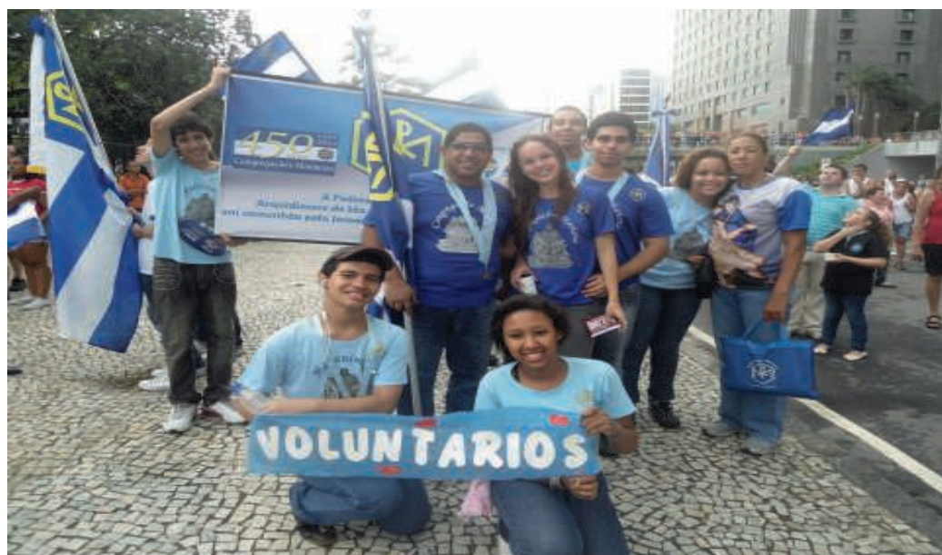
Procissão de São Sebastião