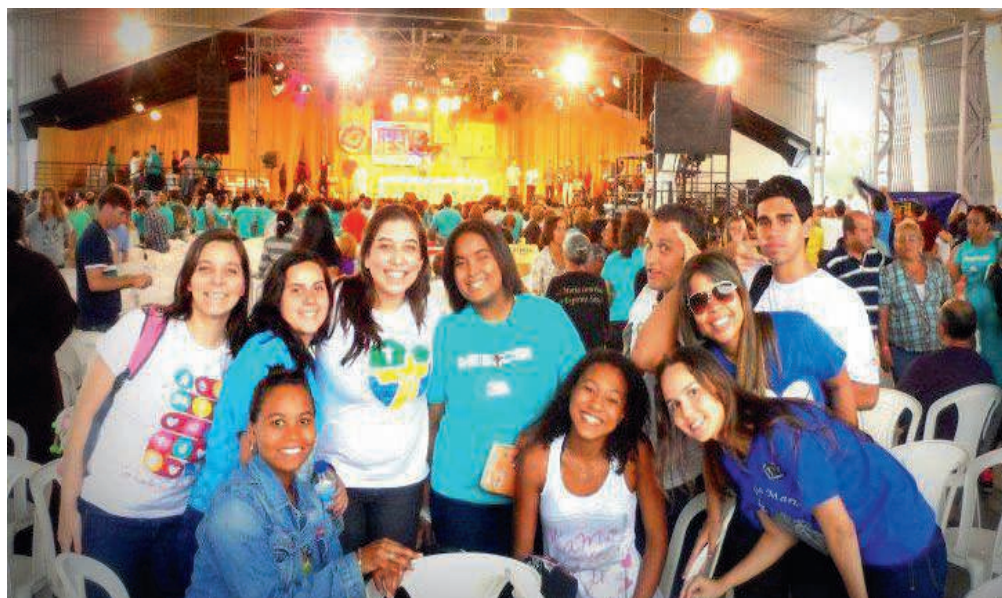
Canção Nova-Juventude Mariana