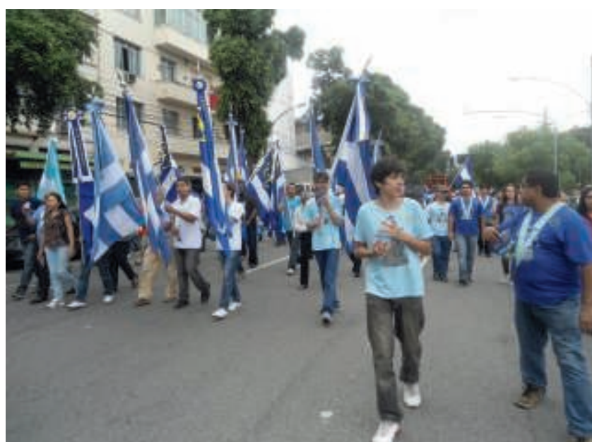
Procissão de São Sebastião