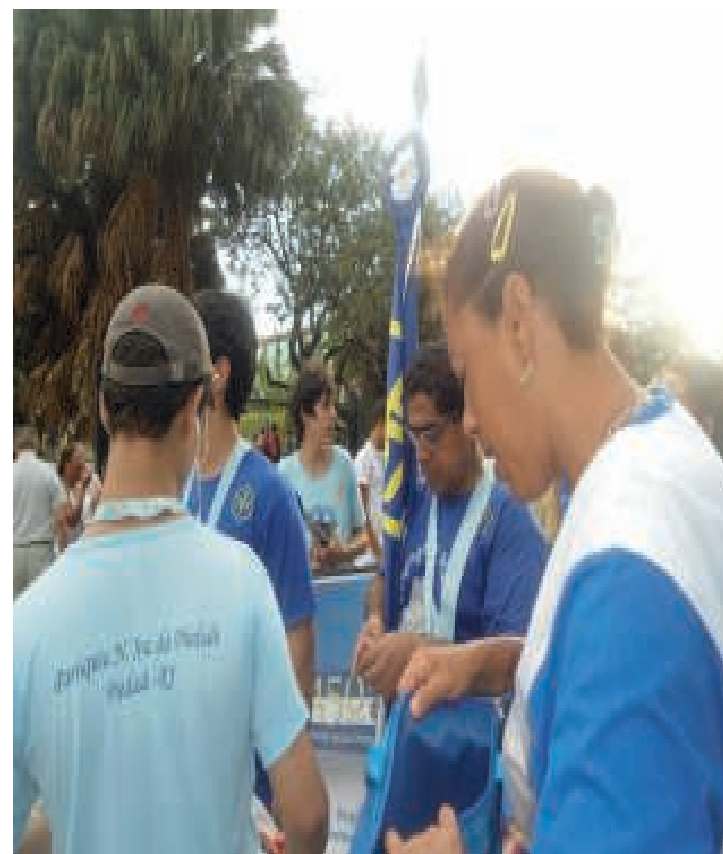
Procissão de São Sebastião