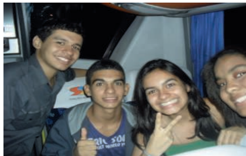
Canção Nova-Juventude Mariana